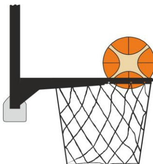
Διάγραμμα 3. Μπάλα μέσα στο καλάθι

31-17 Κατάσταση Είναι παράβαση παρέμβασης (basket interference) εάν ένας αμυνόμενος παίκτης αγγίζει τη μπάλα ενώ η μπάλα είναι μέσα στο καλάθι.