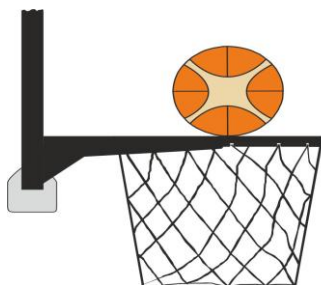
Διάγραμμα 2. Η μπάλα σε επαφή με τη στεφάνη

31-12 Παράδειγμα: Μετά από προσπάθεια για καλάθι από τον Α1, η μπάλα έχει αναπηδήσει από τη στεφάνη και έπειτα πάλι «προσγειώνεται» στη στεφάνη. Ο Β1 αγγίζει το καλάθι ή το ταμπλό ενώ η μπάλα είναι ακόμα στη στεφάνη.