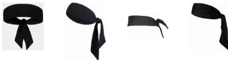
Διάγραμμα1. Παραδείγματα κορδελών κεφαλής

4-4 Κατάσταση. Το να φορούν (οι αθλητές) κορδέλες τύπου φουλάρι, δεν επιτρέπεται.