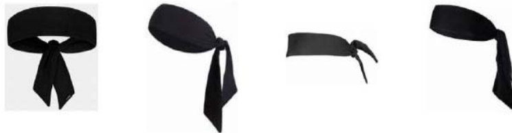
Διάγραμμα1. Παραδείγματα κορδελών κεφαλής τύπου φουλάρι

4-4 Κατάσταση. Το να φορούν (οι αθλητές) κορδέλες τύπου φουλάρι, δεν επιτρέπεται.