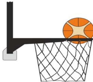
Διάγραμμα 3. Μπάλα μέσα στο καλάθι

31-24 Κατάσταση Είναι παράβαση παρέμβασης (basket interference) εάν ένας αμυνόμενος παίκτης αγγίζει τη μπάλα ενώ η μπάλα είναι μέσα στο καλάθι.