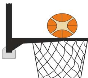
Διάγραμμα 2. Η μπάλα είναι σε επαφή με τη στεφάνη

31-19 Κατάσταση: Η παράβαση παρέμβασης (basket interference) σημειώνεται από έναν αμυνόμενο ή επιτιθέμενο παίκτη κατά τη διάρκεια μιας προσπάθειας για καλάθι όταν ένας παίκτης αγγίζει το καλάθι ή το ταμπλό ενώ η μπάλα είναι σε επαφή με τη στεφάνη και έχει ακόμα τη δυνατότητα να εισέλθει στο καλάθι.